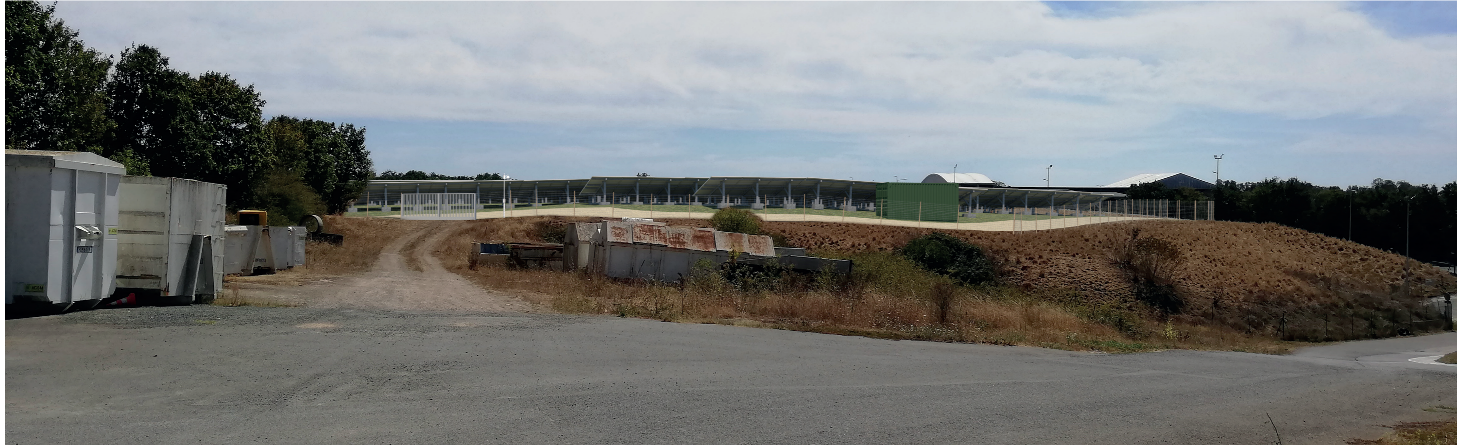
PC6b - Projeté