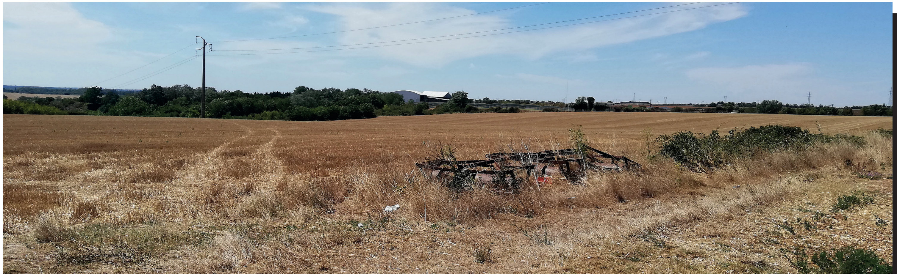
PC6a - Projeté