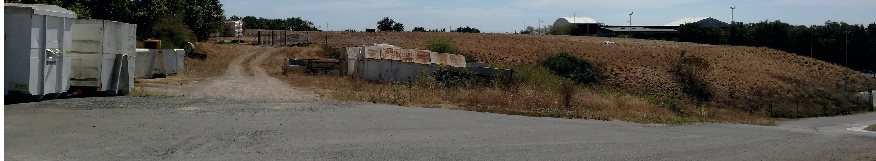
PC6b - Existant