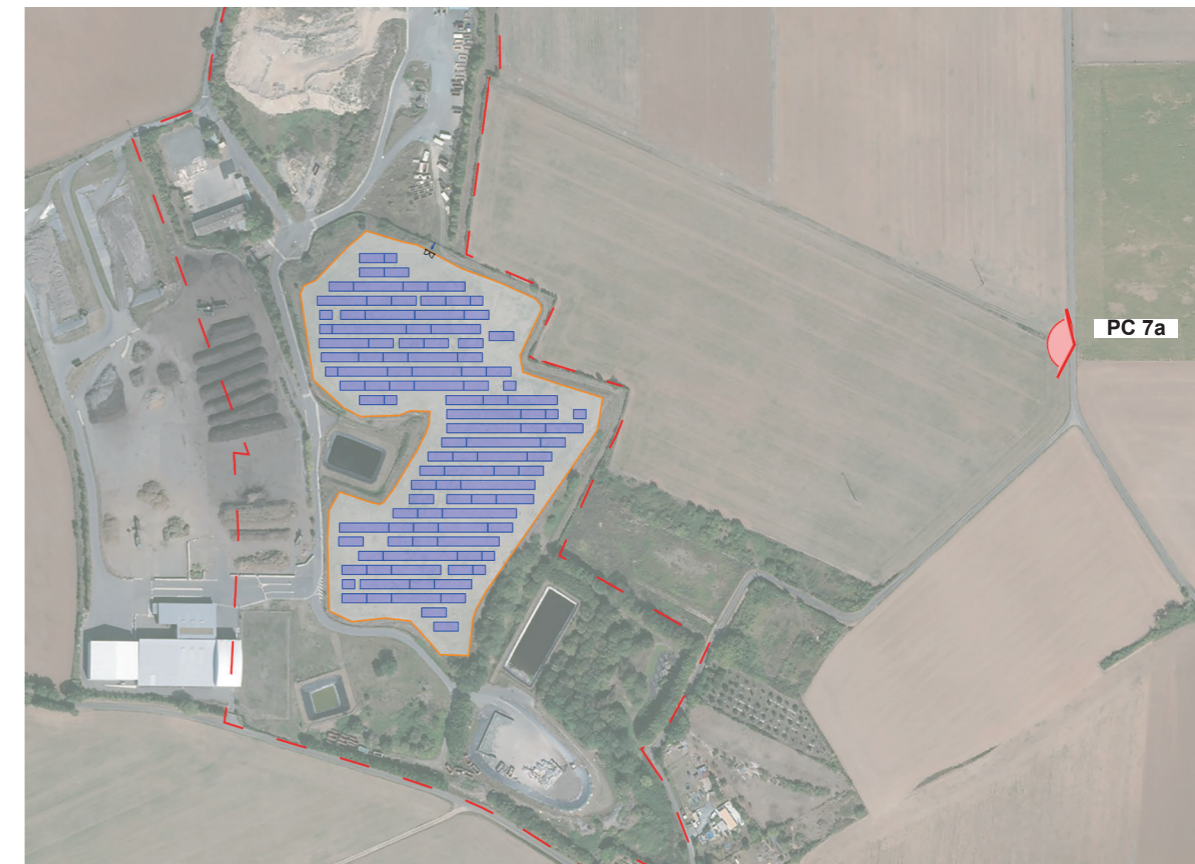
PLAN DE REPÉRAGE DES VUES

AGENCE 2BR SARL BOUILHOL, RAMEL & BERNARD ARCHITECTES DPLG 582, allée de la Sauvegarde 69009 LYON Tél. : 04 78 83 61 87 - Fax : 04 78 83 64 62 Email : agence.lyon@2br.fr