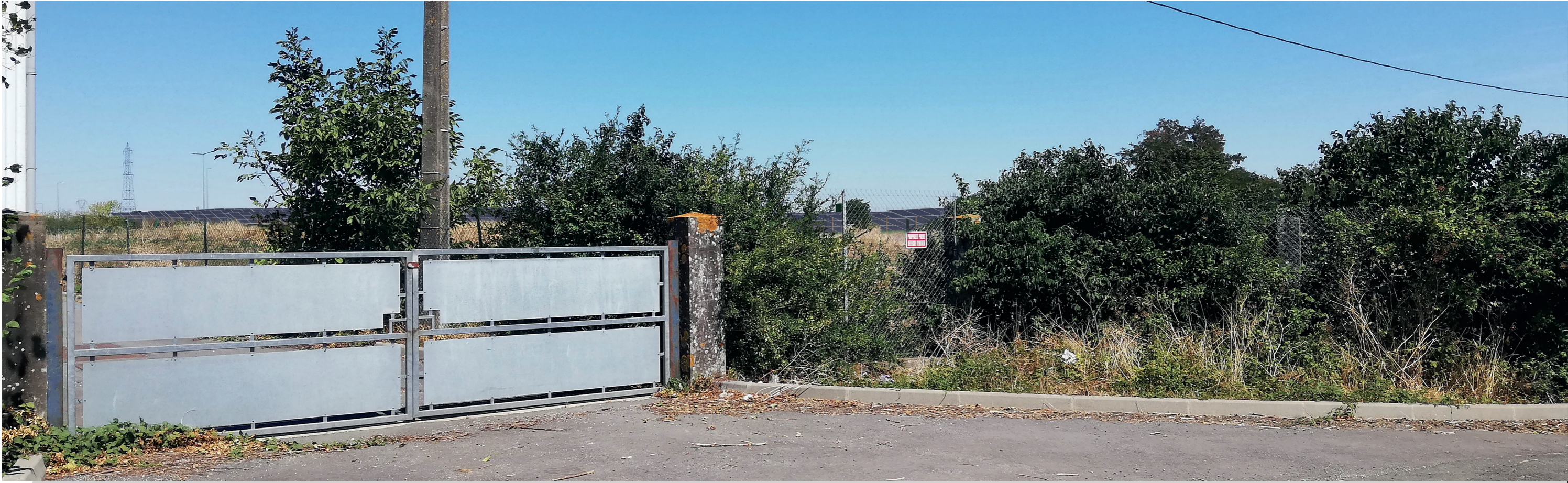
PC6c - Projeté