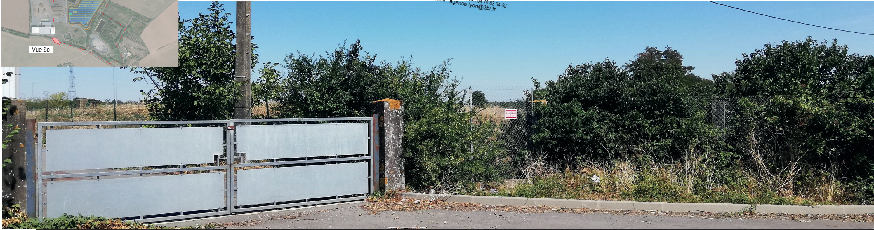
PC6c - Existant