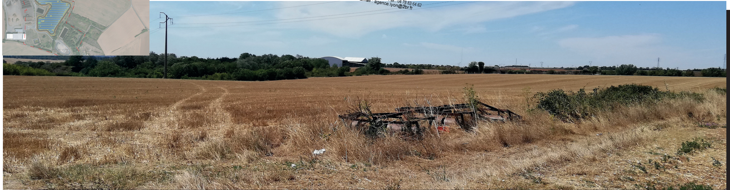
PC6a - Existant